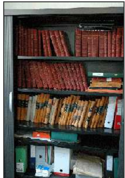
Het archief van Pleaux