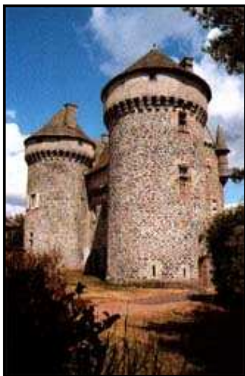
Omgeving Pleaux Chateau la Viane