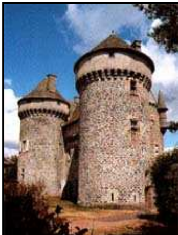
Omgeving Pleaux Chateau la Vigne